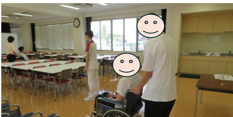
車椅子乗車・操作コーナー 車椅子の操作の仕方を確認した後、車椅子に乗車し実際に操作を体験してもらいました。そして、お友達やご家族が乗った車椅子の操作を行い移動の看護を体験しました。