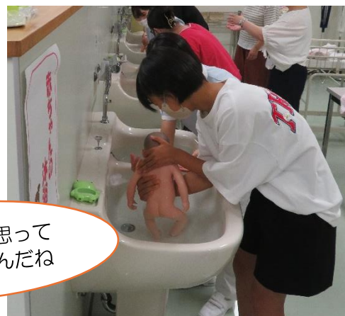
赤ちゃんの抱っこ・お風呂入れ体験コーナー 生まれたばかりの赤ちゃんの抱っこの仕方、お風呂の入れ方を看護学生から教えてもらいながら体験してもらいました。生まれたばかりの赤ちゃんの体重はどれくらい？というクイズにも挑戦しました。